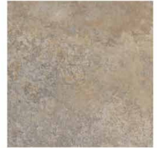
8N8-16039520 500 mm X 500 mm