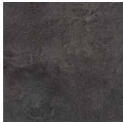
8N6-16039518 500 mm X 500 mm