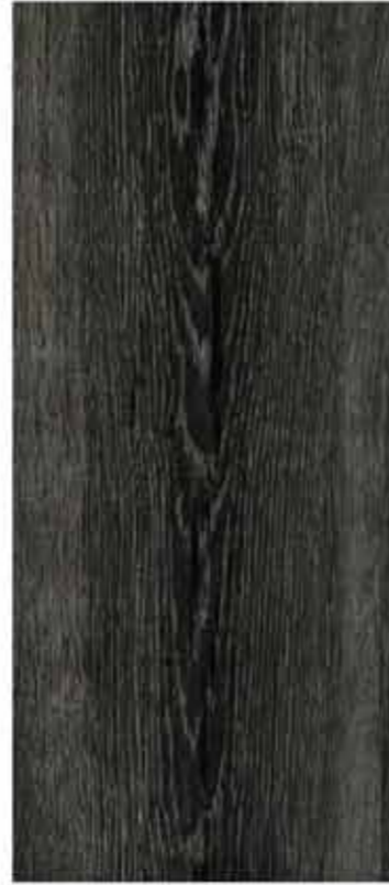
8NH-16039528 184.2 mm X 1219.2 mm