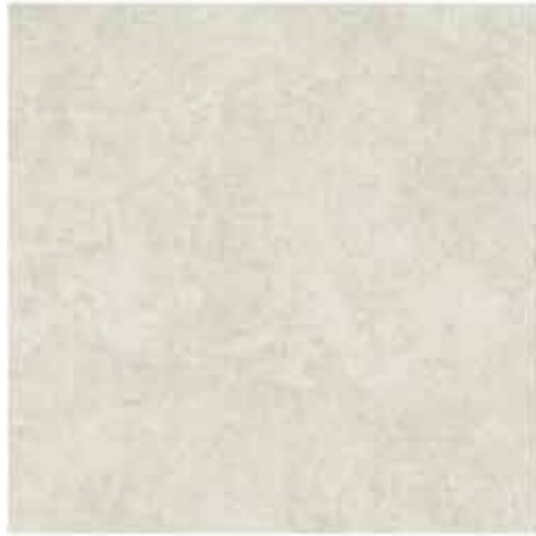
8N1-16039513 500 mm X 500 mm