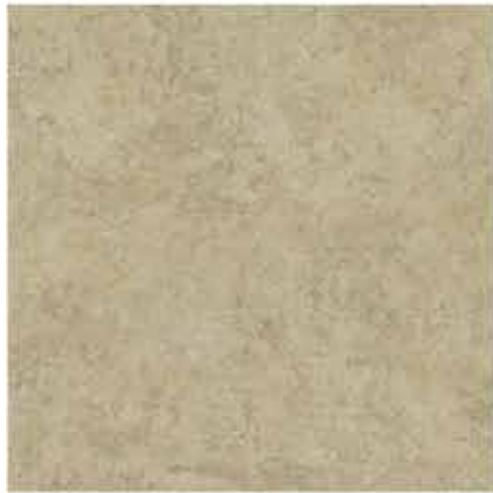
8N2-16039514 500 mm X 500 mm